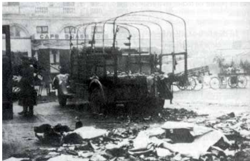
Opération contre les troupes d'occupation, place du Capitole en 1944

(à convenir par mail elerika@wanadoo.fr )